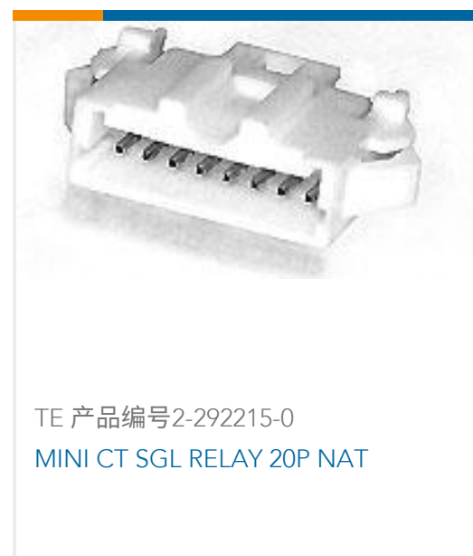
TE 产品编号2-292215-0 MINI CT SGL RELAY 20P NAT