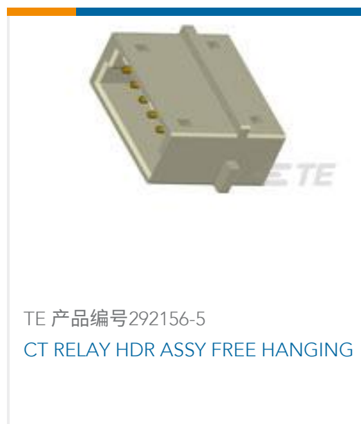
TE 产品编号292156-5 CT RELAY HDR ASSY FREE HANGING