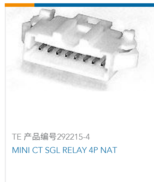
TE 产品编号292215-4 MINI CT SGL RELAY 4P NAT