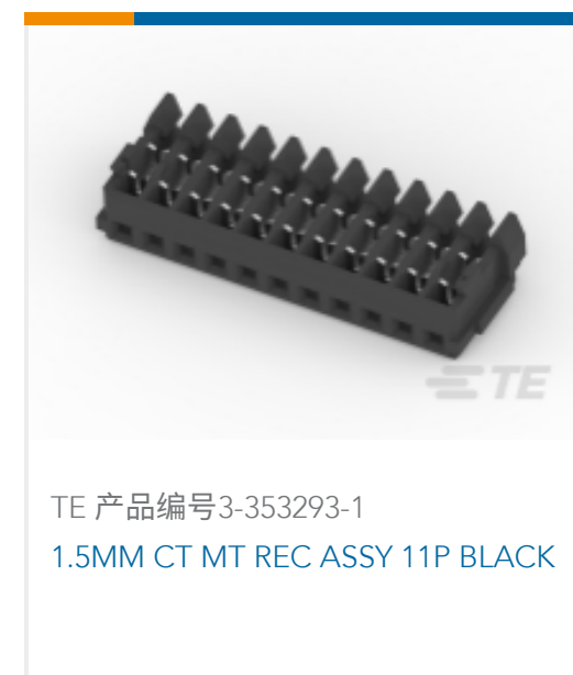
TE 产品编号3-353293-1 1.5MM CT MT REC ASSY 11P BLACK