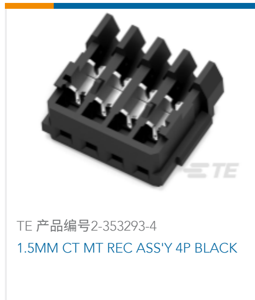
TE 产品编号2-353293-4 1.5MM CT MT REC ASS'Y 4P BLACK