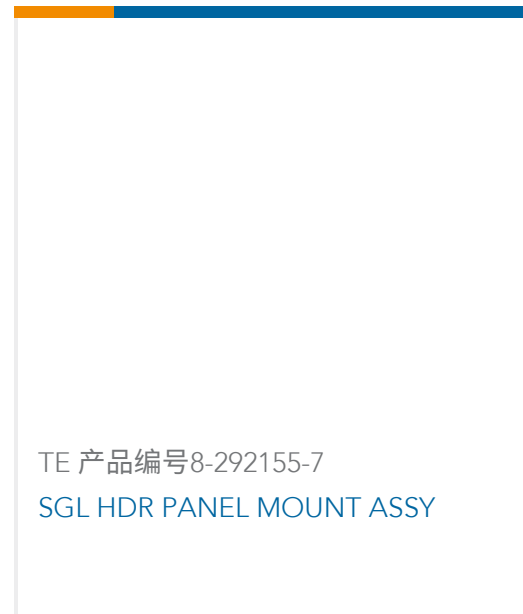
TE 产品编号8-292155-7 SGL HDR PANEL MOUNT ASSY