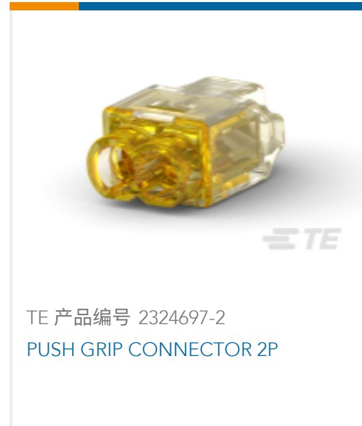
TE 产品编号 2324697-2 PUSH GRIP CONNECTOR 2P