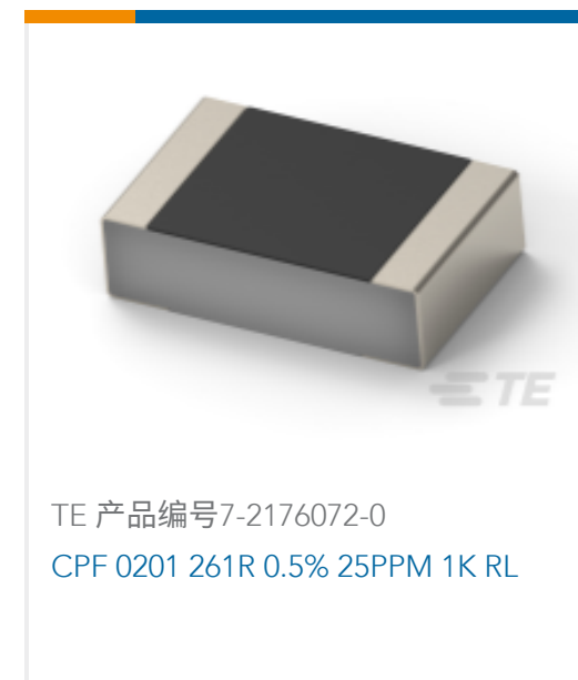
TE 产品编号7-2176072-0 CPF 0201 261R 0.5% 25PPM 1K RL