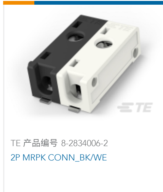
TE 产品编号 8-2834006-2 2P MRPK CONN_BK/WE