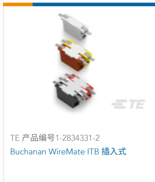
TE 产品编号1-2834331-2 Buchanan WireMate ITB 插入式