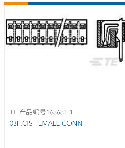
TE 产品编号163681-1 03P.CIS FEMALE CONN