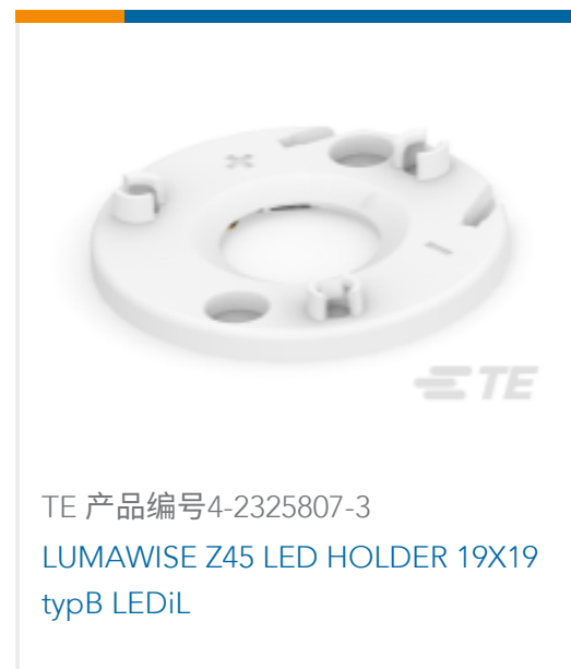
TE 产品编号4-2325807-3 LUMAWISE Z45 LED HOLDER 19X19 typB LEDiL