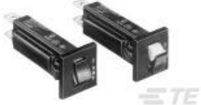
TE 产品编号3-1393250-9 W28-XQ1A-6=W28-