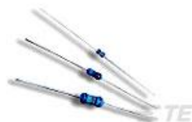
TE 产品编号1622414-1 LR1 1% 2K2