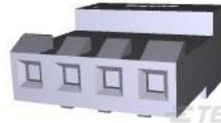
TE 产品编号3-640429-4 04P MTA156 CONN ASSY 24AWG WHT