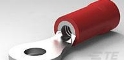
TE 产品编号34143 PG R 22-16 COMM 22-18 MIL 4