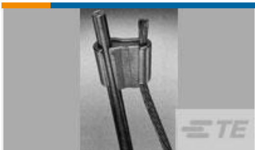
TE 产品编号1-276337-3 AMPACT CU TAP 500-3/0