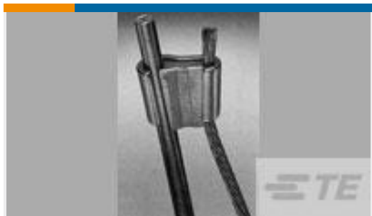
TE 产品编号3-276337-3 AMPACT CU TAP 400-250