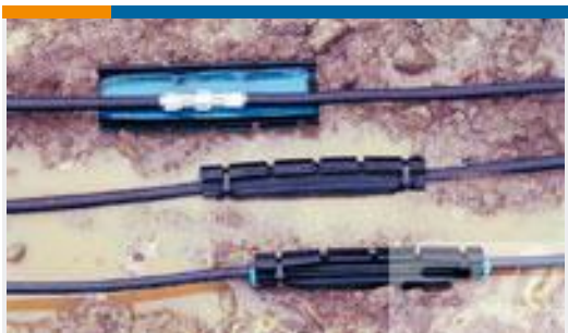
TE 产品编号971920-000 GELWRAP-18/4-250(B6)