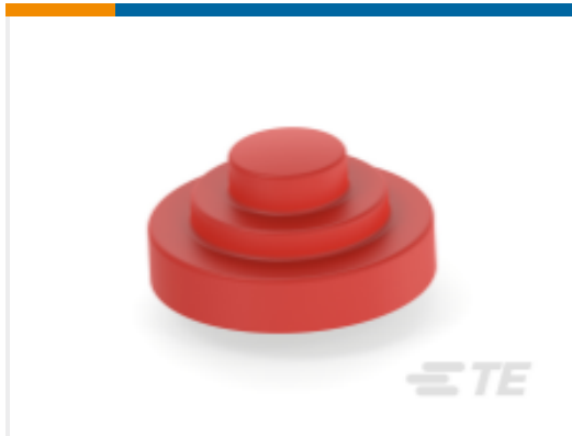
TE 产品编号J2745D-000 ALR-NS-10ANSI