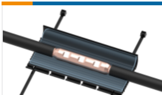
TE 产品编号128958-000 GELWRAP-50/20-300(B12)