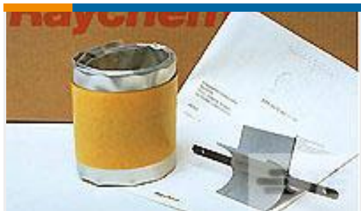
TE 产品编号059487-000 RDSS-AT/AP-150