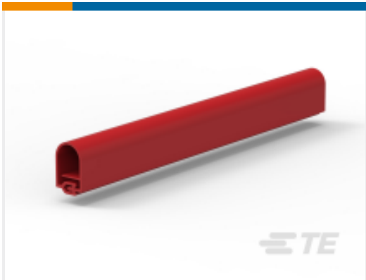
TE 产品编号269732-000 MVLC-18-A/U-C(75)