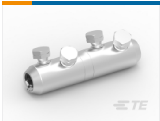
TE 产品编号1974130-1 ASBS 3/0-500-S