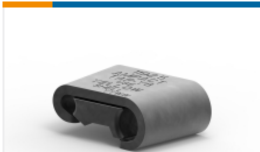
TE 产品编号602300-2 AMPACT 楔形压力分接连接器