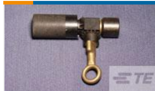
TE 产品编号306347-1 AMPACT GEARED BREECH CAP ASSY