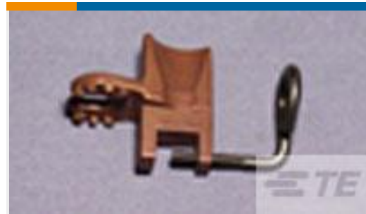
TE 产品编号306348-1 AMPACT WEDGE HOLDER