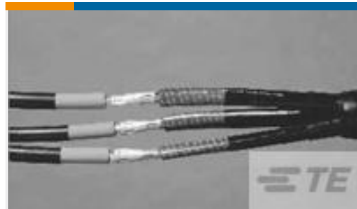
TE 产品编号812965-000 HVS-T-3582S