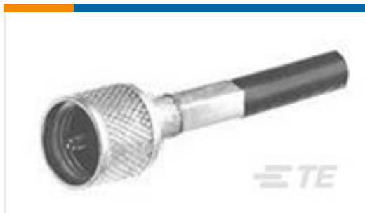
TE 产品编号330830 UHF PLUG ASSEMBLY