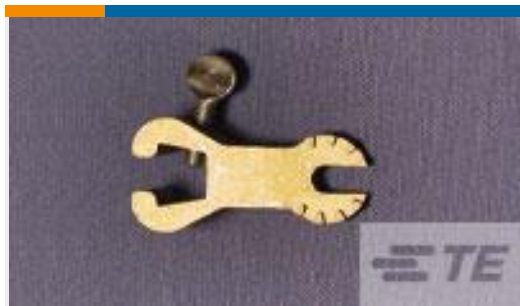
TE 产品编号306349-1 AMPACT TOOL HOLDER FOR 69611