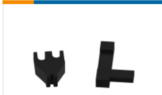
TE 产品编号690786-1 TERMINAL SUPPORT (.767)