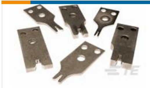
TE 产品编号4-238018-6 CRIMPER-INSULATION-O