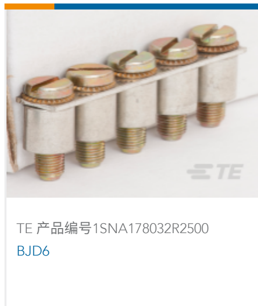
TE 产品编号1SNA178032R2500 BJD6