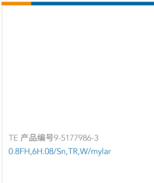
TE 产品编号9-5177986-3 0.8FH,6H.08/Sn,TR,W/mylar