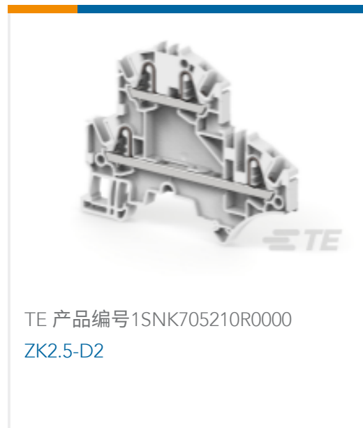
TE 产品编号1SNK705210R0000 ZK2.5-D2