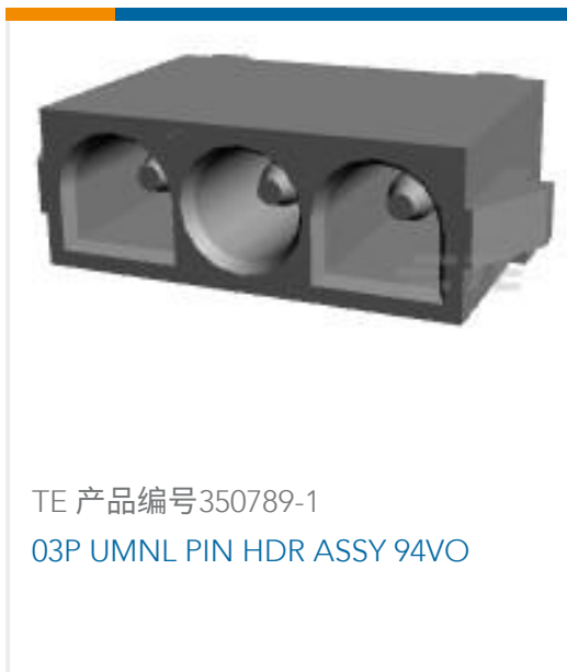
TE 产品编号350789-1 03P UMNL PIN HDR ASSY 94VO