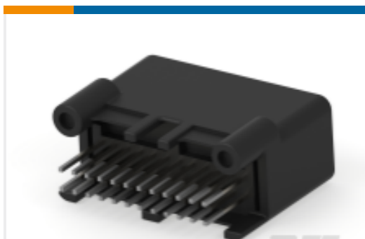
TE 产品编号1376111-6 025 24 POS CAP ASSY V