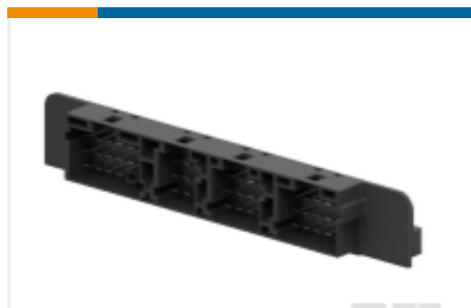
TE 产品编号1376113-5 High Pin Count Header