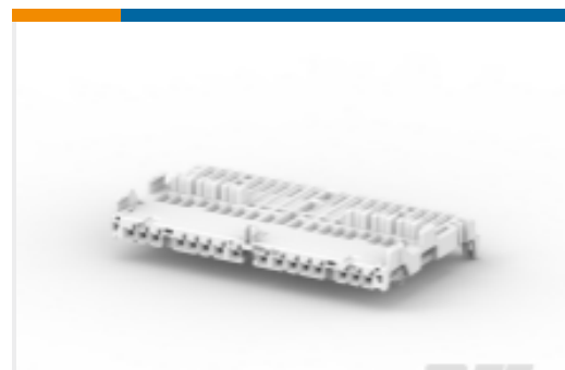
TE 产品编号1903883-1 0.50 SERIES CONN 16POS PLUG HOUSING ASSY