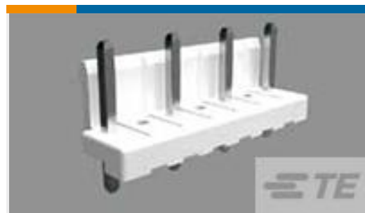
TE 产品编号6-1123724-4 3.96EP HDR ASSY 4(7)P GREEN