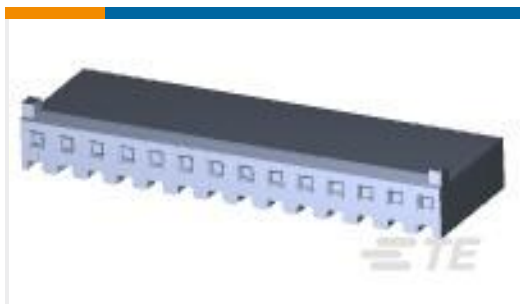
TE 产品编号1-770849-4 14P SL156 HSG W/LOC RAMP W/TBS