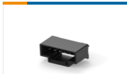
TE 产品编号6-1971798-5 NEW GI CONN2.5 HDR ASMBLY 6P BLK D1.0