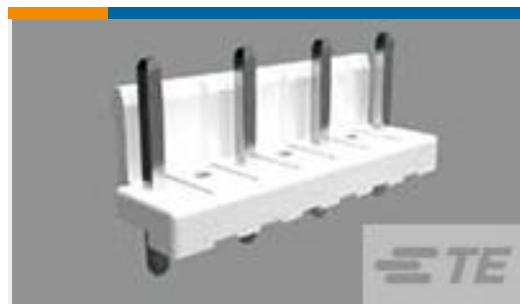
TE 产品编号6-1123724-2 3.96EP HDR ASSY 2(3)P GREEN