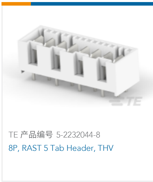
TE 产品编号 5-2232044-8 8P, RAST 5 Tab Header, THV