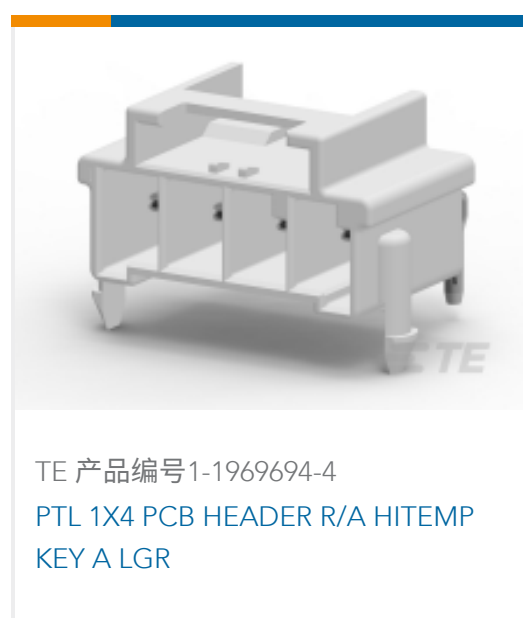
TE 产品编号1-1969694-4 PTL 1X4 PCB HEADER R/A HITEMP KEY A LGR