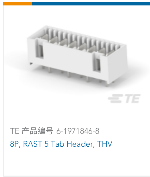
TE 产品编号 6-1971846-8 8P, RAST 5 Tab Header, THV