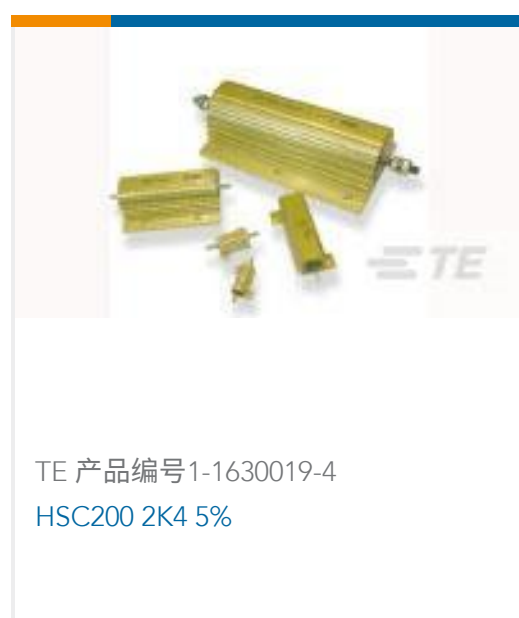
TE 产品编号1-1630019-4 HSC200 2K4 5%