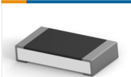
TE 产品编号9-2176388-7 RQ 1206 100R 0.1% 10PPM 5K RL