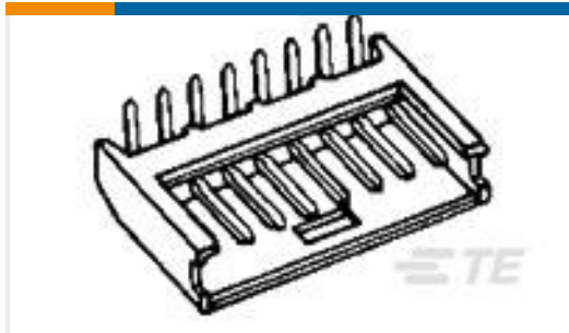
TE 产品编号280380-2 8P MODU II SHRD HDR,RT ANG, 0.38 AU