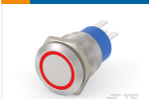
TE 产品编号2-2213767-7 AV19 SPL 5A MOVE RING LED RED 24V