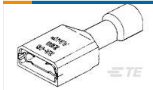
TE 产品编号2-520403-2 ULTRA-FAST 187 ASY REC 22-18 TPBR