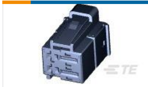
TE 产品编号1-1418507-2 SOCKET HSG 4POS.,AMP MCP2.8 /MCP6.3K