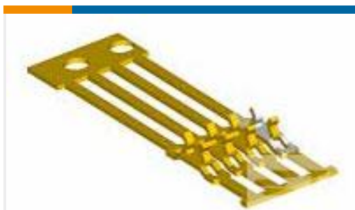
TE 产品编号1544187-2 CONTACT