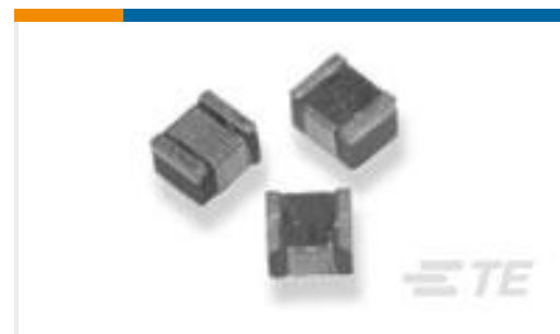
TE 产品编号1879023-3 3650 1008 12nH 5% 2K RL