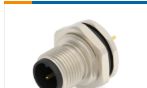
TE 产品编号T4140012021-000 M12, REAR MOUNTING, MALE, A CODE, 2P