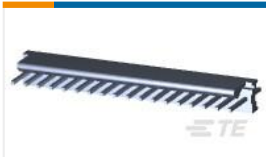
TE 产品编号1-641215-8 18P MTA100 HDR ASSY FL/ST 30AU