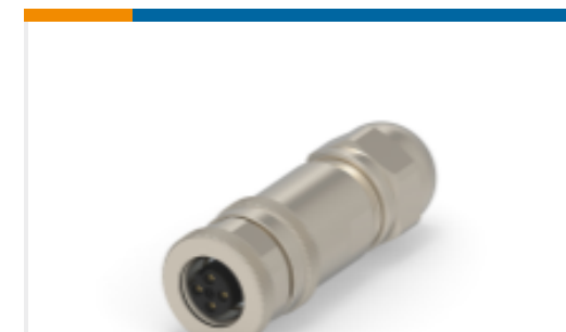
TE 产品编号T4110411041-000 M12 F, 4P GOLD B_CODE S SHIELDED PG7