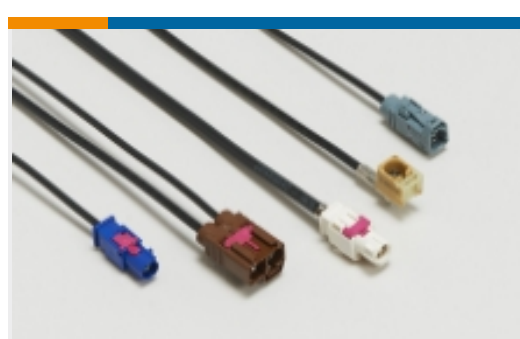
信息娱乐和多媒体线束(1)