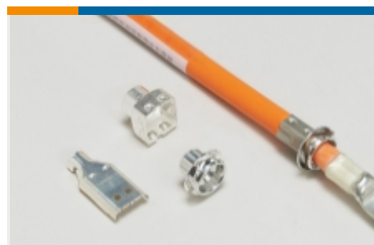
汽车连接器 EMC 屏蔽(5)