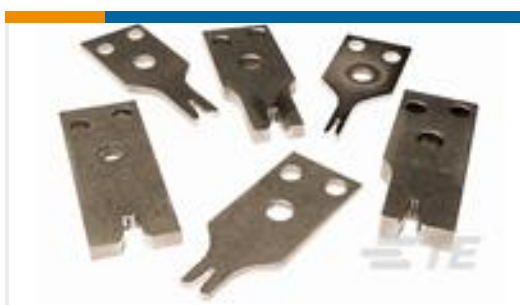
TE 产品编号7-1633305-8 CRIMPER, WIRE PREMIUM (.077" 'F')