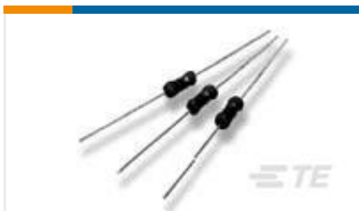
TE 产品编号7-1879354-5 RR03 5% 390R AMMO