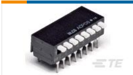
TE 产品编号2-1571999-6 ADP0804=PIANO DIP SWITCH