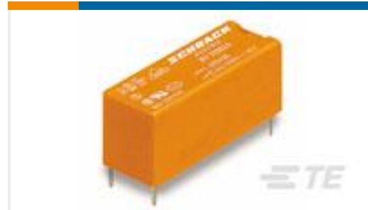
TE 产品编号4-1393224-3 RY211006