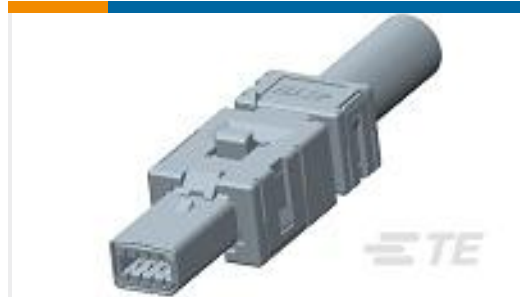
TE 产品编号1-2201855-1 MINI I/O PLUG KIT TYPE II L