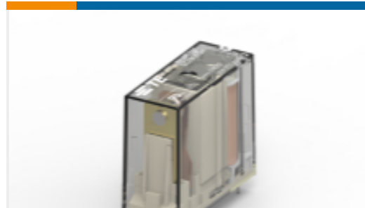
TE 产品编号1393230-7 RP3SL005