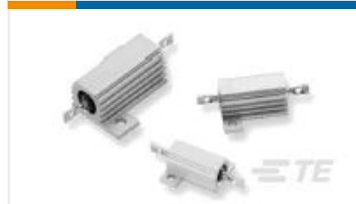
TE 产品编号3-1879073-4 THS10 120R 5%