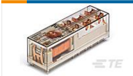
TE 产品编号1393260-4 SR6B4012 - V23050-A1012-A542