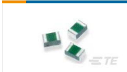
TE 产品编号1624345-1 NTC0805 5% 10K