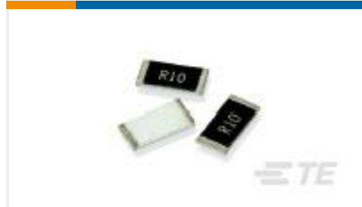
TE 产品编号1-2176058-7 RLP73M 3A R047 5% 2K RL