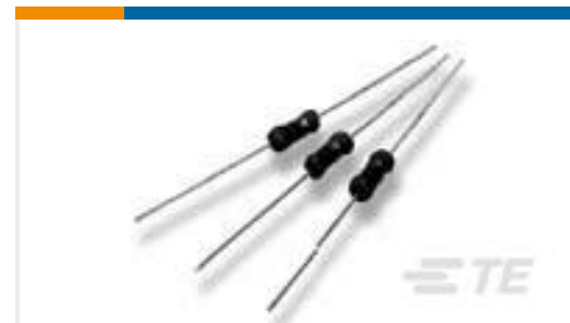
TE 产品编号5-1625892-3 3W SM M/OX 5% 47K