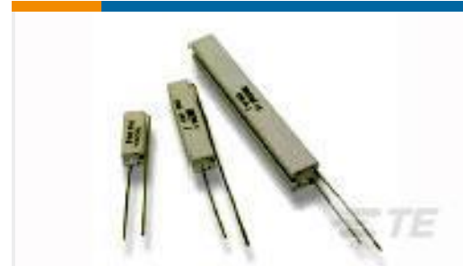
TE 产品编号1-1623729-3 BCHE 17 W 22R 5%