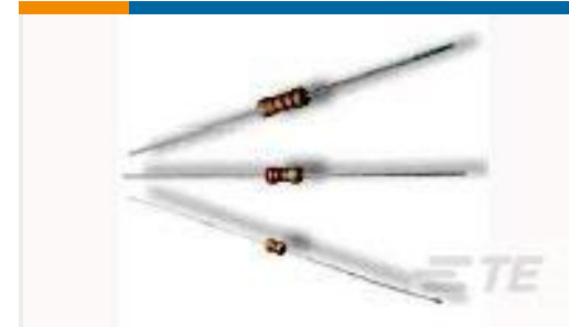
TE 产品编号3-1623933-4 CFR50 5% 4K7