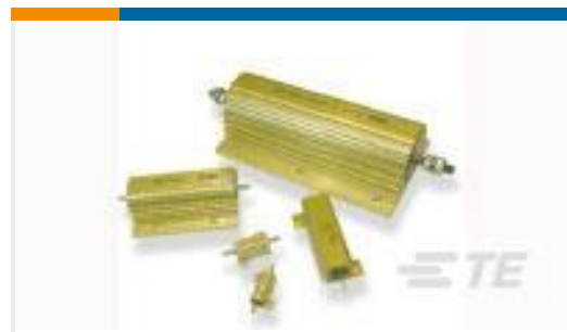
TE 产品编号9-1625971-5 HSA25 R01 10%