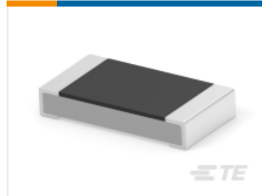
TE 产品编号2-2176392-9 RQ 1206 261K 0.1% 10PPM 5K RL