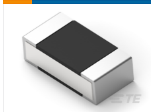
TE 产品编号3-2176307-2 RP 1E 0.1W 26K1 0.1% 25PPM 5K RL