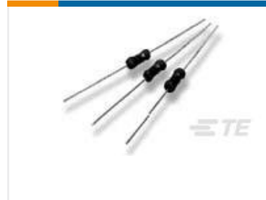
TE 产品编号1-1879353-9 RR02 5% 24K AMMO