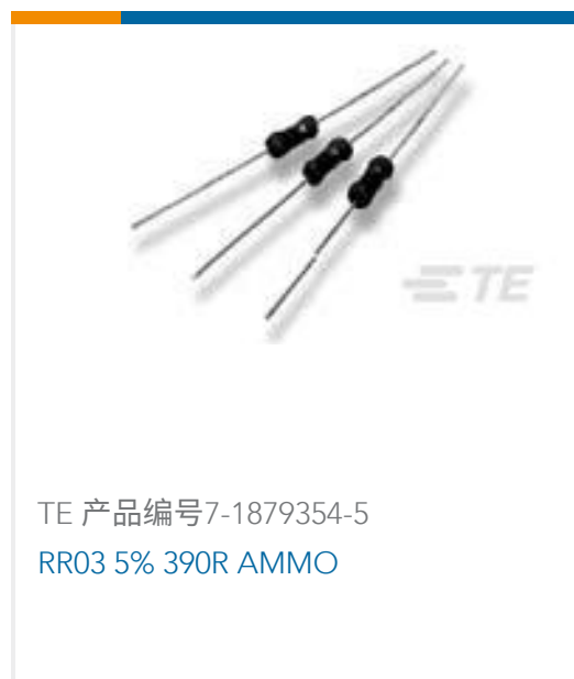
TE 产品编号7-1879354-5 RR03 5% 390R AMMO