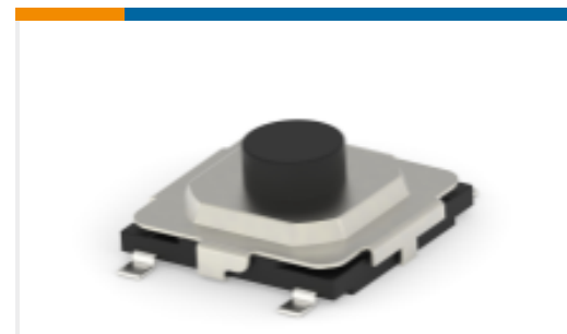
TE 产品编号2337238-3 TACT MINI GW 5.2X5.2X2 160GF