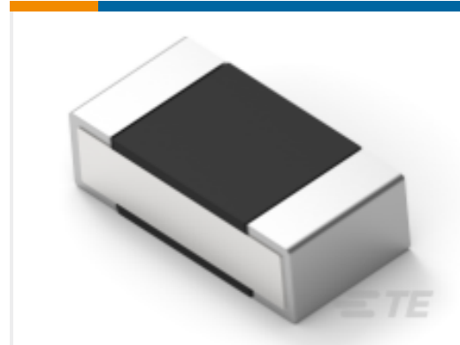
TE 产品编号7-2176305-3 RP 1E 0.1W 604R 0.1% 25PPM 5K RL