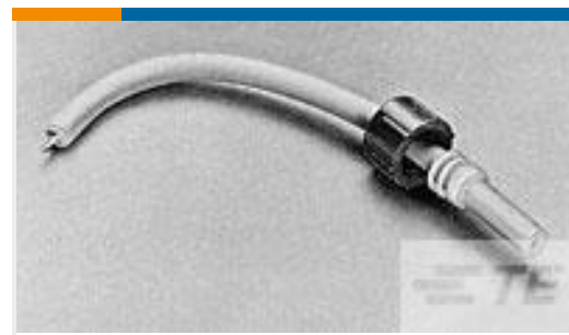
TE 产品编号1-830611-0 LGH 1/2 SNGL MLD END