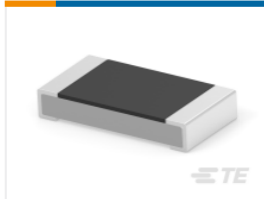
TE 产品编号2-2176392-9 RQ 1206 261K 0.1% 10PPM 5K RL