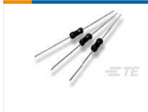
TE 产品编号1-1879353-9 RR02 5% 24K AMMO