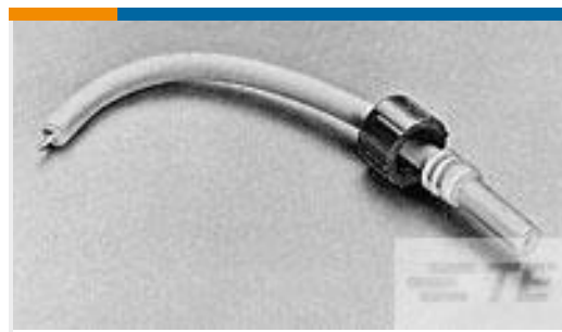
TE 产品编号1-830611-0 LGH 1/2 SNGL MLD END