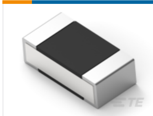
TE 产品编号7-2176305-3 RP 1E 0.1W 604R 0.1% 25PPM 5K RL