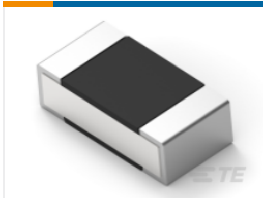
TE 产品编号3-2176307-2 RP 1E 0.1W 26K1 0.1% 25PPM 5K RL