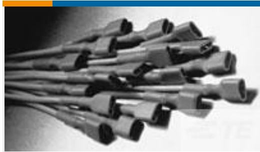
TE 产品编号1804294001 LSTT-3.2-0-SP