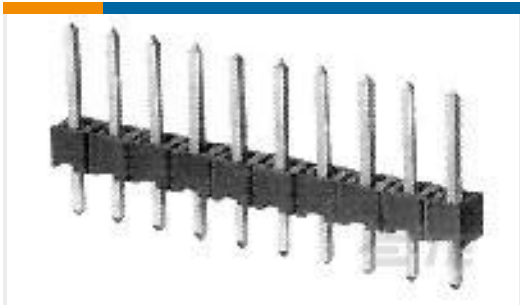
TE 产品编号825433-5 MOD 2 PINHDR 1X5 P.