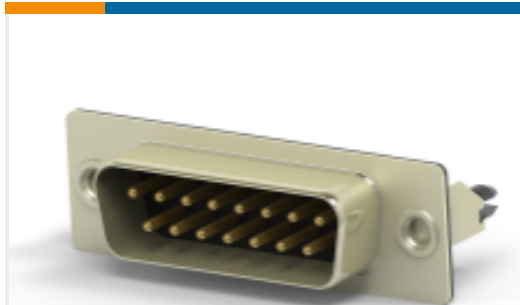
TE 产品编号2301828-1 AMPL PLUG HD20, VERT, 15P, B/L,4- 40 INS