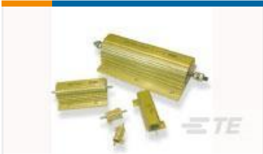
TE 产品编号5-1625984-7 HSA50 3R9 5%