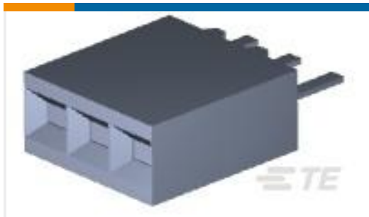
TE 产品编号5-534237-1 03 MODII VRT SR CE 100/115