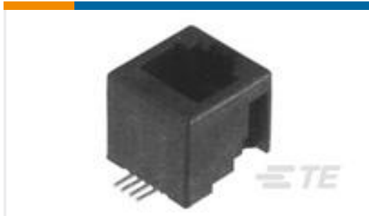
TE 产品编号1-338086-6 6/6 INV.MOD.JACK