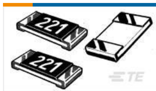
TE 产品编号8-2176230-3 3522 5M6 5% 3W