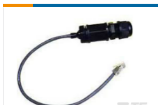
TE 产品编号RJ45-ECS RJ45,ECS,12in