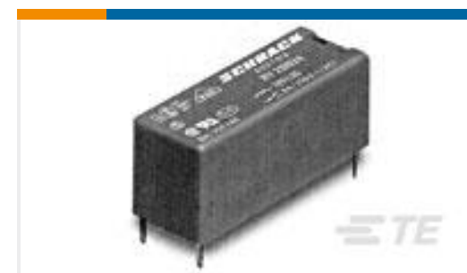
TE 产品编号2-1393225-1 RY611024