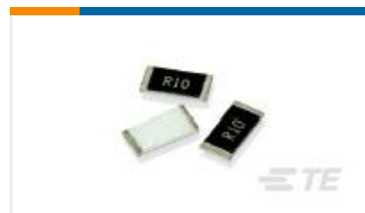
TE 产品编号3-2176058-4 RLP73K 3A R24 5% 2K RL