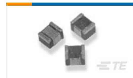
TE 产品编号8-1624112-9 3650 0603 0.18uH 5% 2K RL