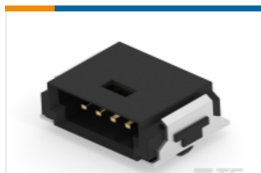
TE 产品编号214012-E SRCA 1,27 4 M 1 SMD 137 E1 094 * GURT *