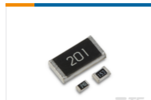
TE 产品编号3-2176326-9 CRGP 0603 15K 1%