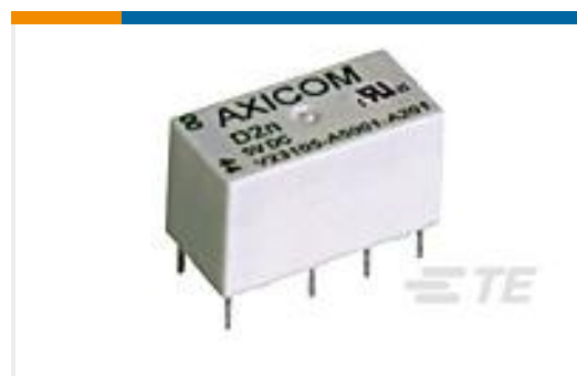
TE 产品编号9-1393792-7 V23105A5303A201