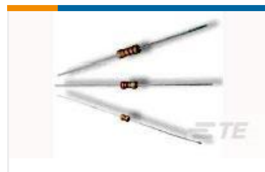
TE 产品编号1623930-3 CFR25 5% 10K