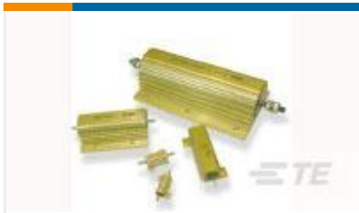
TE 产品编号5-1625999-6 HSC100 1R0 1%