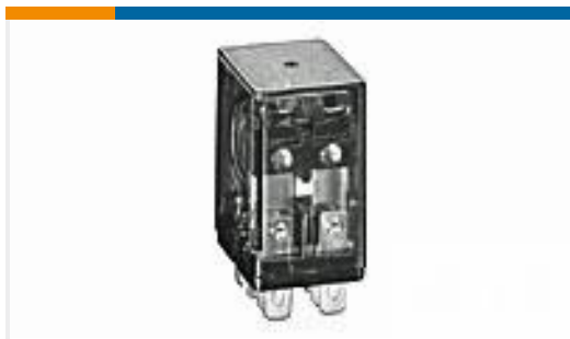
TE 产品编号5-1393144-0 K10P-11DT5-12=K10/K20