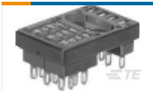
TE 产品编号3-1393143-4 27E317=SOCKET, R10, 2POLE, W /BRACKET