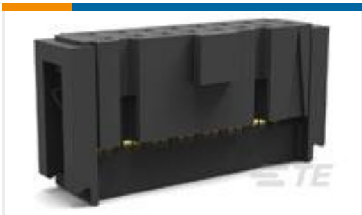
TE 产品编号1658527-3 622-1030LF FEM SOCKET, LEAD FREE