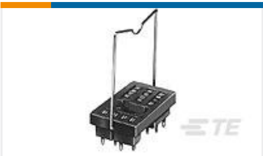
TE 产品编号3-1393159-5 20C249=SPRING, HOLD-DOWN, R10, 0