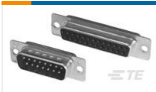
TE 产品编号5-747905-7 9 Rcpt Solder Cup, G/F w/ CN,