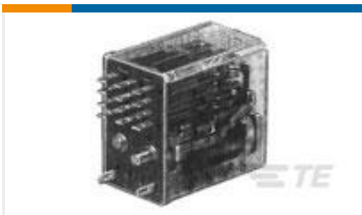
TE 产品编号3-1393766-0 R10-E1Y1-SS220=R10