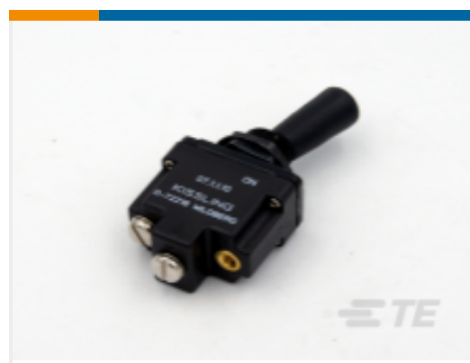
TE 产品编号K1007153 Toggle Switch 08-1-1-13