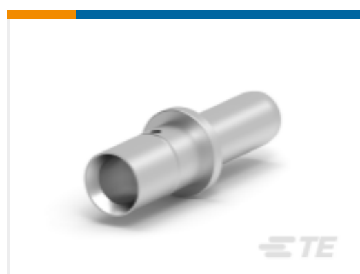
TE 产品编号SRK-PC-080-25-601 PIN, SOLID, SIZE M8, 25mm2, AG