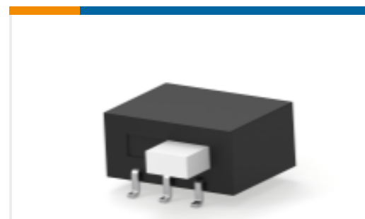
TE 产品编号1-1437581-1 ASE22RL=AUTOSLIDE DP 0.3W