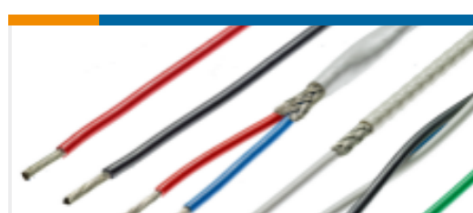
TE 产品编号D81041-000 44B1831-22-MST3-9CS2275