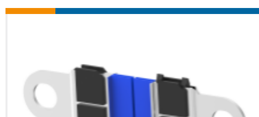
TE 产品编号766488-1 CABLE ASSY, AMPPOWER WAVE CRIMP