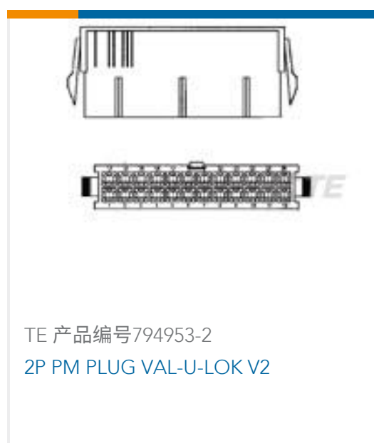
TE 产品编号794953-2 2P PM PLUG VAL-U-LOK V2