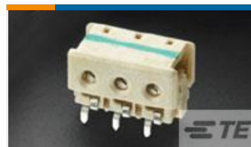
TE 产品编号3-2106751-1 Connector, Thru Hole-IDC, 1 pos, 24AWG