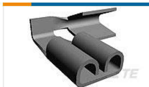
TE 产品编号63990-1 110 FASTON FLAG REC 22-16 AWG TPBR