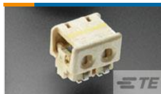
TE 产品编号3-2106003-1 Connector, SMT-IDC, 1 POS, 24 AWG