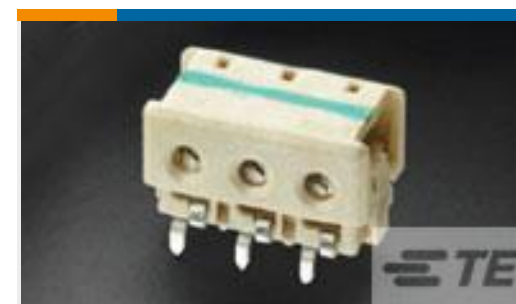
TE 产品编号3-2106751-1 Connector, Thru Hole-IDC, 1 pos, 24AWG