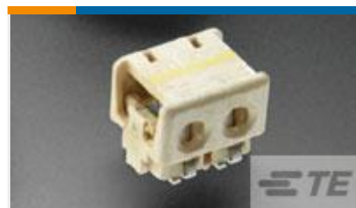
TE 产品编号2106431-2 Connector, SMT-IDC PASS THRU, 2 POS, 18