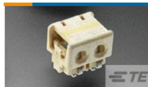
TE 产品编号3-2106003-1 Connector, SMT-IDC, 1 POS, 24 AWG