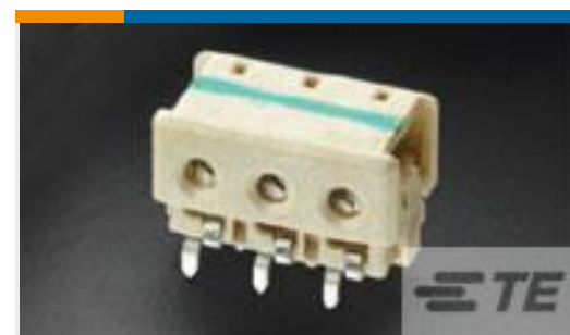
TE 产品编号3-2106751-1 Connector, Thru Hole-IDC, 1 pos, 24AWG