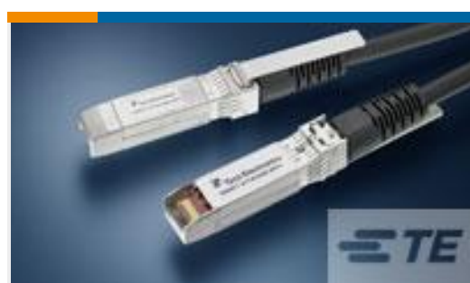
TE 产品编号2127933-1 C/A, SFP+, GENERIC, 0.5M