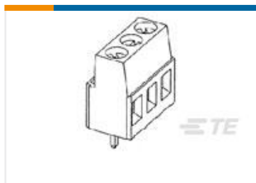
TE 产品编号1-282858-2 12P. TERMI-BLOK PCB MOUNT 90