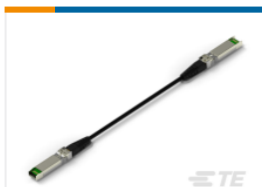
TE 产品编号2821224-7 SFP28 DIRECT ATTACH CA, 4M, 26AWG