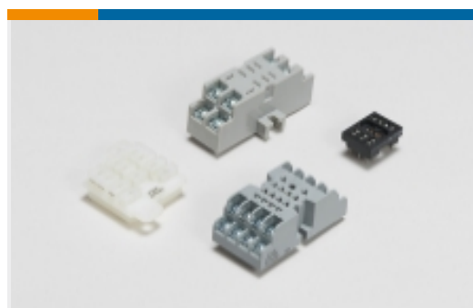
继电器附件、插座和卡笼(5)