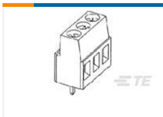
TE 产品编号1-282841-1 TERMI-BLOK PCB MOUNT 11P.5