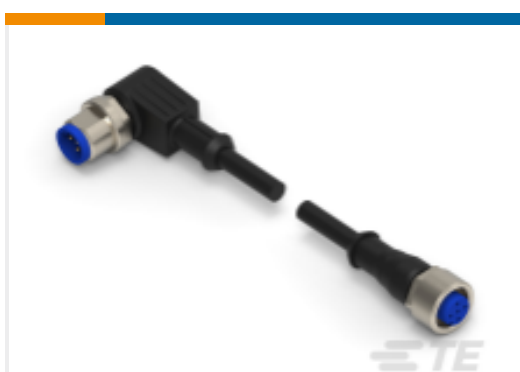
TE 产品编号1-2273120-5 M12 MR-FS Double End Cable Assembly BL