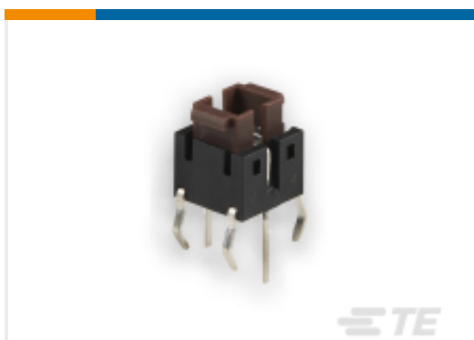
TE 产品编号6-2213818-1 6X6 ILL TACT THT 520GF HI SOFT ORANGE