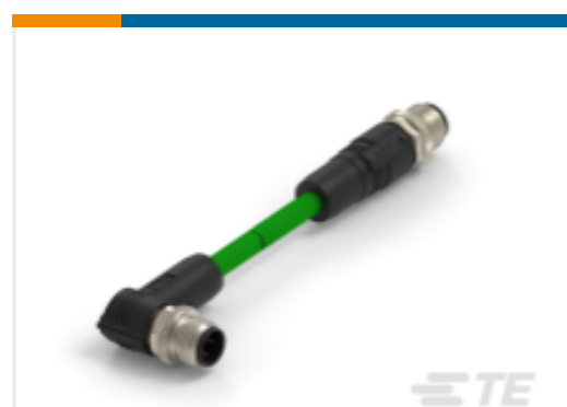
TE 产品编号TAD14841111-005 M12D4-MS-MR-PVC TYPE B-5.0M