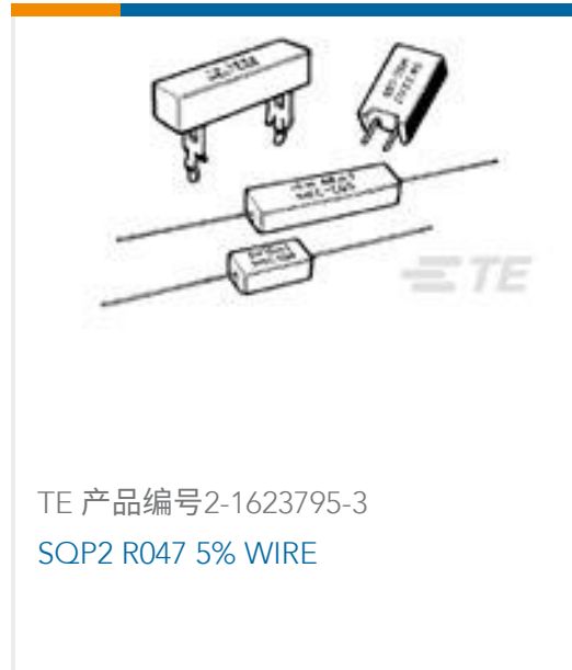
TE 产品编号2-1623795-3 SOP2 R047 5% WIRE