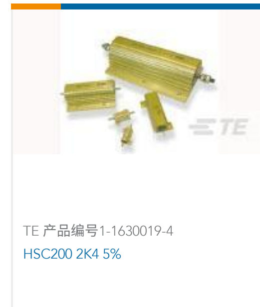
TE 产品编号1-1630019-4 HSC200 2K4 5%