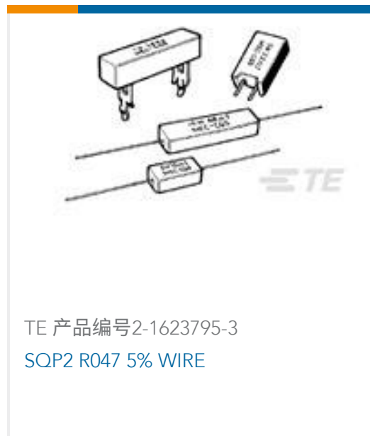
TE 产品编号2-1623795-3 SOP2 R047 5% WIRE