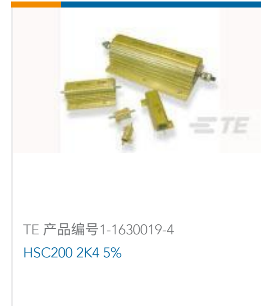
TE 产品编号1-1630019-4 HSC200 2K4 5%