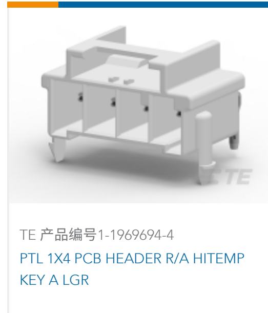
TE 产品编号1-1969694-4 PTL 1X4 PCB HEADER R/A HITEMP KEY A LGR