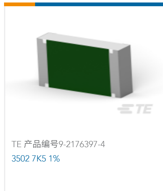
TE 产品编号9-2176397-4 3502 7K5 1%