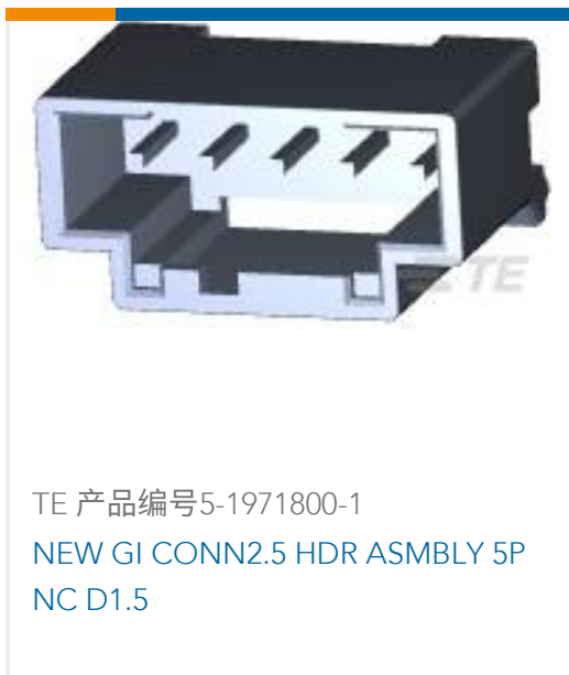
TE 产品编号5-1971800-1 NEW GI CONN2.5 HDR ASMBLY 5P NC D1.5