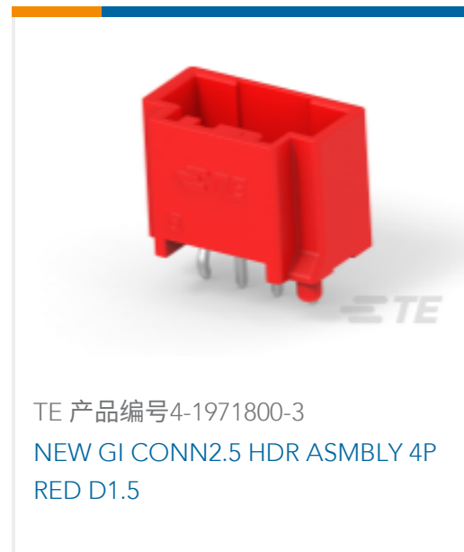
TE 产品编号4-1971800-3 NEW GI CONN2.5 HDR ASMBLY 4P RED D1.5