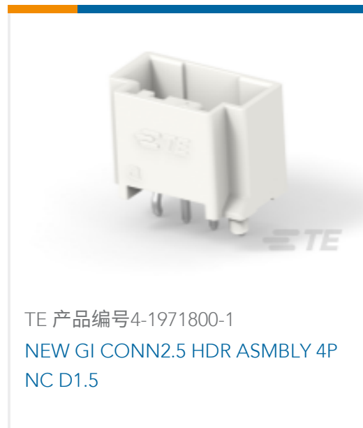
TE 产品编号4-1971800-1 NEW GI CONN2.5 HDR ASMBLY 4P NC D1.5