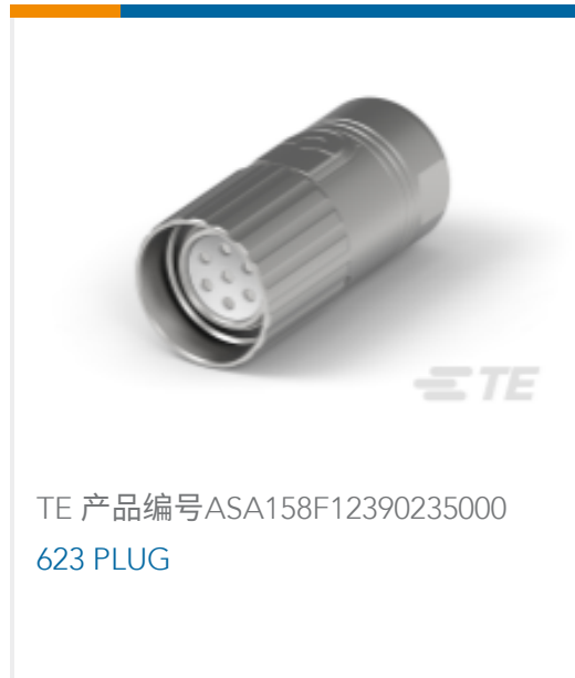
TE 产品编号ASA158F12390235000 623 PLUG