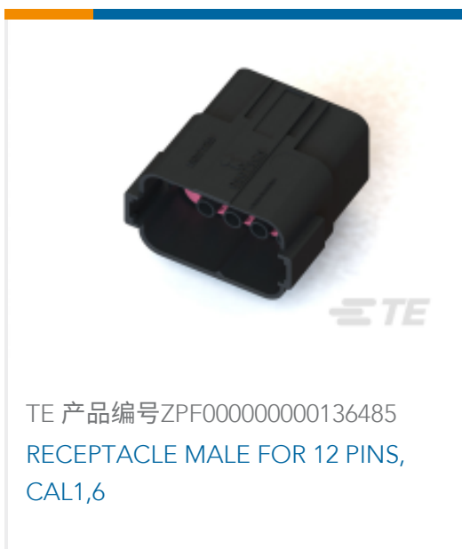
TE 产品编号ZPF000000000136485 RECEPTACLE MALE FOR 12 PINS, CAL1,6