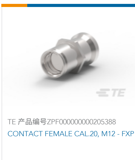
TE 产品编号ZPF000000000205388 CONTACT FEMALE CAL.20, M12 - FXP