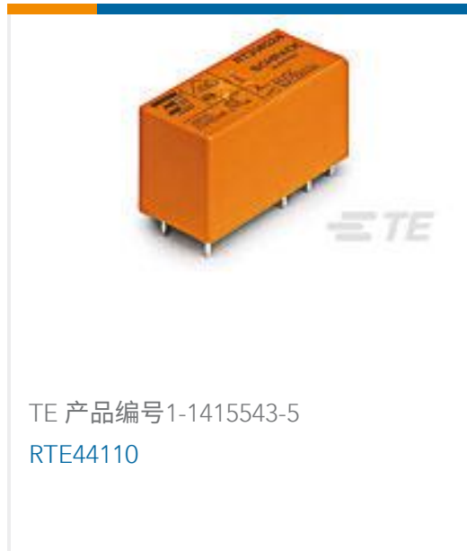
TE 产品编号1-1415543-5 RTE44110