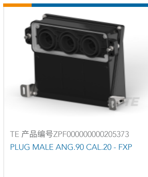
TE 产品编号ZPF000000000205373 PLUG MALE ANG.90 CAL.20 - FXP