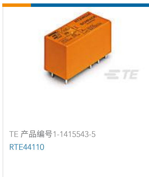
TE 产品编号1-1415543-5 RTE44110