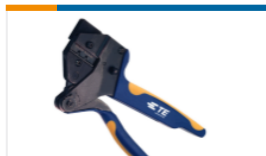
TE 产品编号2217208-1 SDE COMMERCIAL TOOL AND DIE