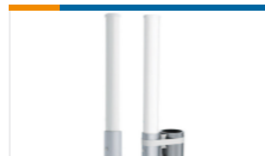
TE 产品编号OC69271-FNM LTE Omni Direct Mount 698-2700MHz 3.5dBi