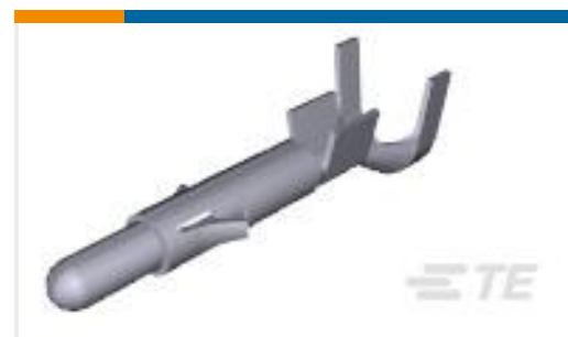
TE 产品编号350538-6 UMNL PIN 20-14 AU/NI/PHBZ