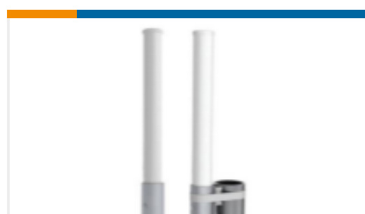
TE 产品编号OC69421-FNM OMNI,DBAND,FIXED,NM 698-4200MHz,1.5dBi