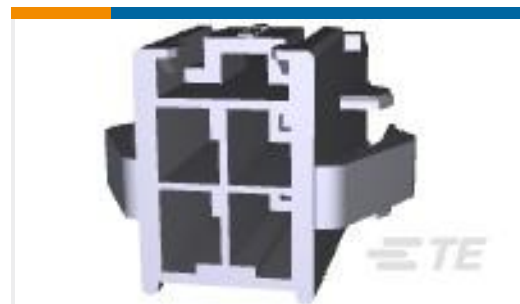
TE 产品编号177908-4 POWER DBL LOCK CAP HSG P/M 4P