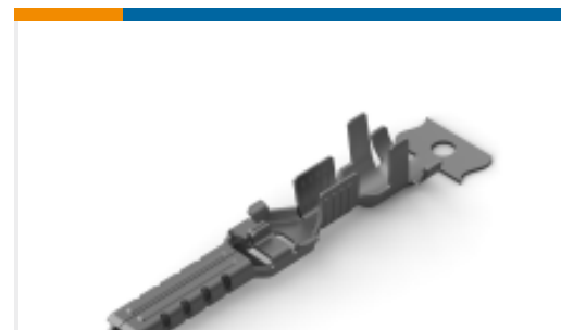
TE 产品编号1971782-1 Tab Contact — POWER TRIPLE LOCK