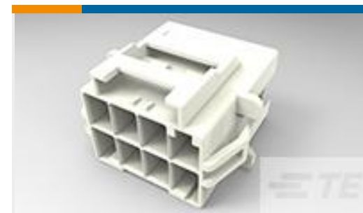
TE 产品编号1-1971775-4 PTL 2X4 CAP PANEL MT STD TEMP KEY A NAT