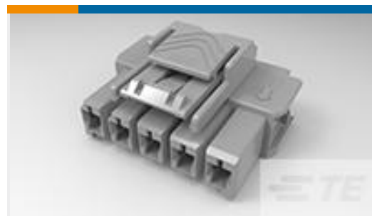
TE 产品编号5-1971773-7 PTL 1X5 PLUG HSG HIGH TEMP KEY A LGR