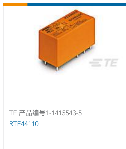
TE 产品编号1-1415543-5 RTE44110