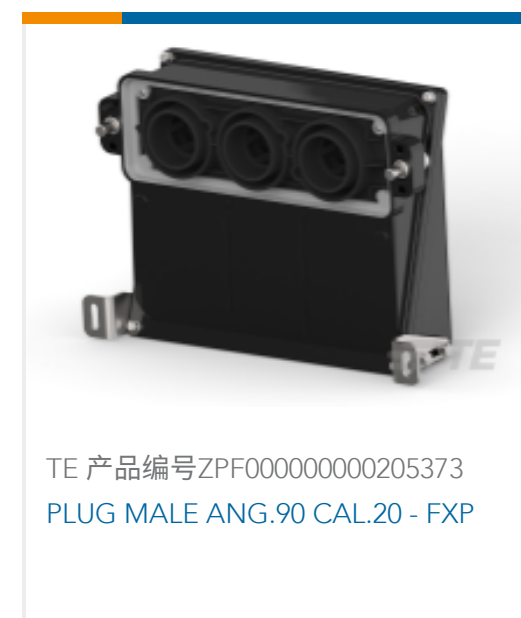
TE 产品编号ZPF000000000205373 PLUG MALE ANG.90 CAL.20 - FXP