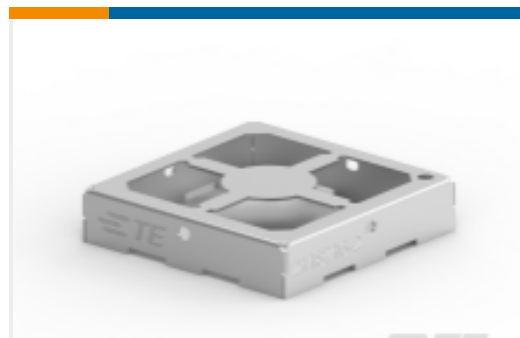
TE 产品编号2118716-2 STD SHIELD FRAME, CRS-16.50X16. 50X3.60MM