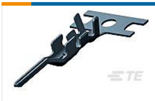
TE 产品编号2238007-1 TERMINAL, PIN, LANCELESS, 22-26 AWG, EP2