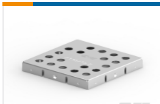
TE 产品编号2118715-2 STD SHIELD COVER, CRS-16.90X16. 90X2.00MM