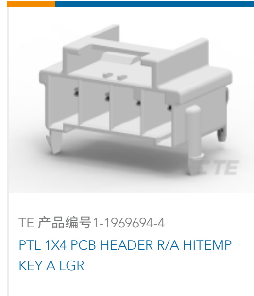
TE 产品编号1-1969694-4 PTL 1X4 PCB HEADER R/A HITEMP KEY A LGR