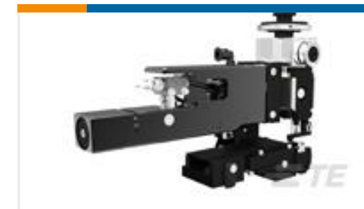
TE 产品编号2151279-2 OCEAN_2.0_APPLICATOR-S-080F1000-RSA