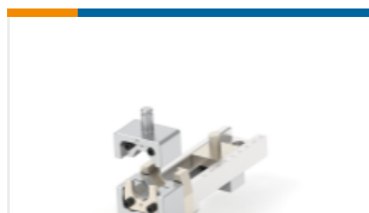
TE 产品编号2351900-2 DIE SET2 IPT-180-1/2/3P F 50MM2