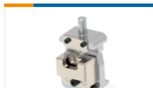
TE 产品编号2358638-1 DIE SET DIA 6MM T 6MM2