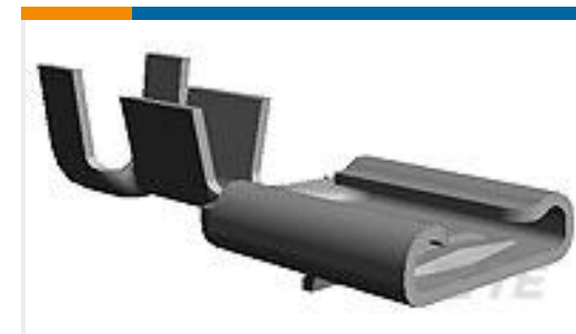
TE 产品编号160920-4 FF 312 REC 2.5-4MM2 TPPB