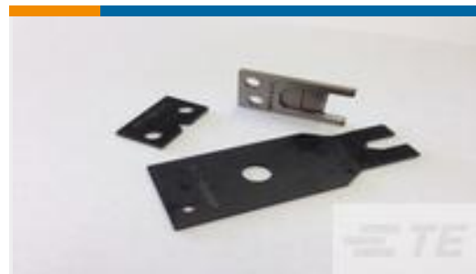
TE 产品编号1-2217206-5 Blade, Slug