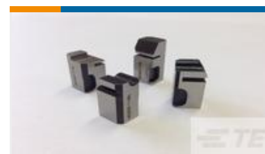
TE 产品编号318059-8 FLOATING SHEAR, FRONT