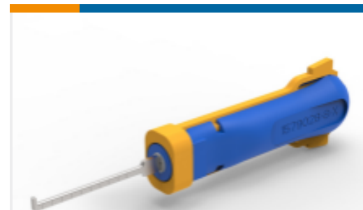
TE 产品编号1579028-8 EXTRACTION TOOL