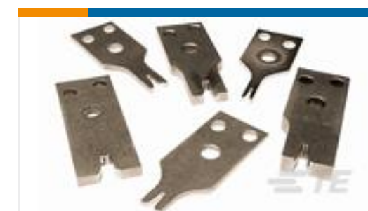
TE 产品编号5-1490019-5 CRIMPER, WIRE (.073" 'F')