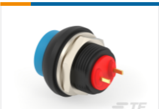
TE 产品编号2-2329328-0 PB OFF/ON HC BLU M4 TERM. IP68