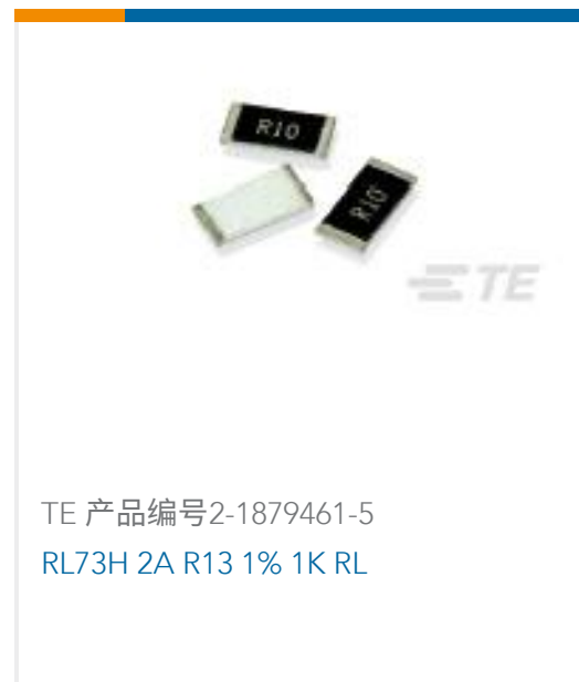
TE 产品编号 2-1879461-5 RL73H 2A R13 1% 1K RL