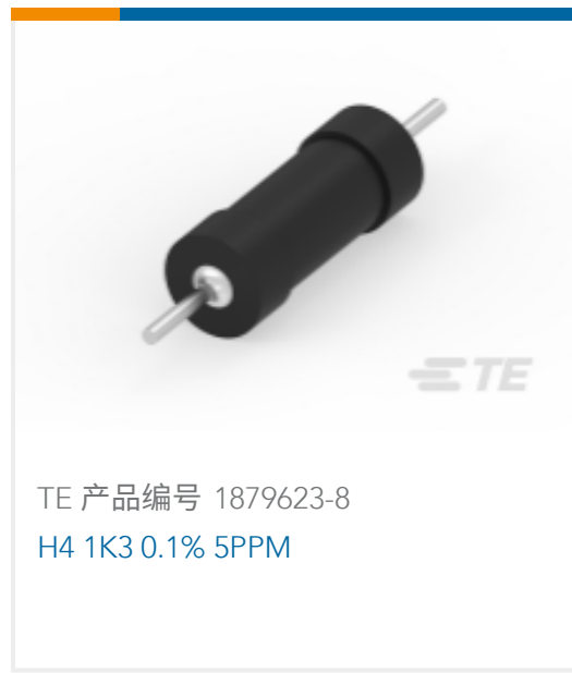
TE 产品编号 1879623-8 H4 1K3 0.1% 5PPM