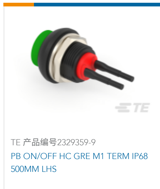
TE 产品编号 2329359-9 PB ON/OFF HC GRE M1 TERM IP68 500MM LHS