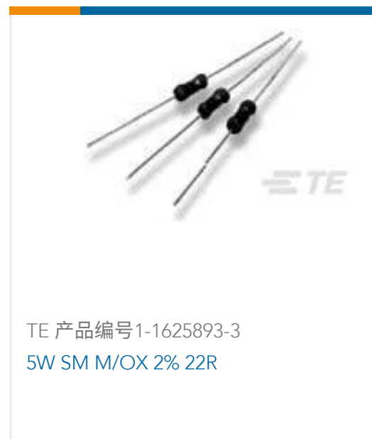
TE 产品编号 1-1625893-3 5W SM M/OX 2% 22R