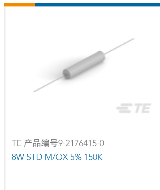
TE 产品编号 9-2176415-0 8W STD M/OX 5% 150K