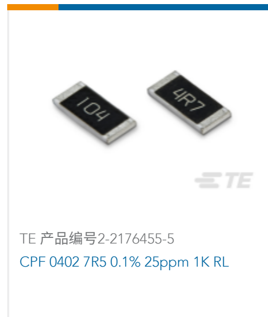
TE 产品编号 2-2176455-5 CPF 0402 7R5 0.1% 25ppm 1K RL