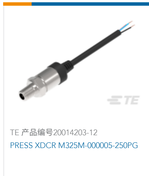
TE 产品编号 20014203-12 PRESS XDCR M325M-000005-250PG