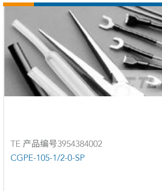
TE 产品编号 3954384002 CGPE-105-1/2-0-SP