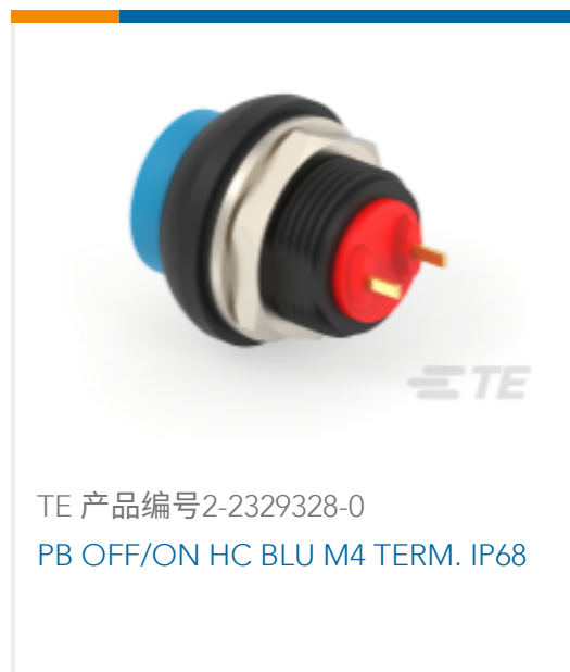
TE 产品编号 2-2329328-0 PB OFF/ON HC BLU M4 TERM. IP68