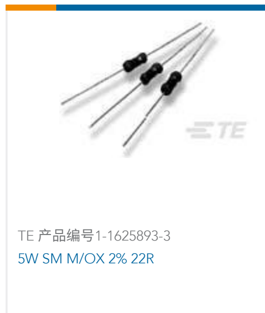
TE 产品编号 1-1625893-3 5W SM M/OX 2% 22R