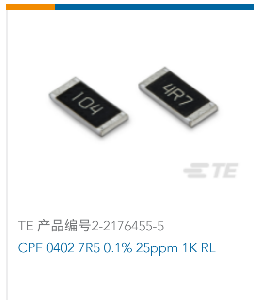
TE 产品编号 2-2176455-5 CPF 0402 7R5 0.1% 25ppm 1K RL