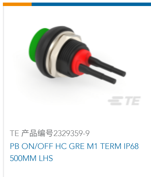
TE 产品编号 2329359-9 PB ON/OFF HC GRE M1 TERM IP68 500MM LHS