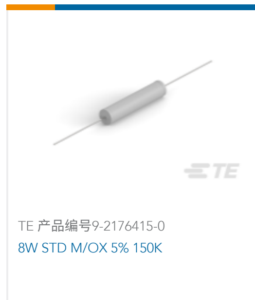
TE 产品编号 9-2176415-0 8W STD M/OX 5% 150K