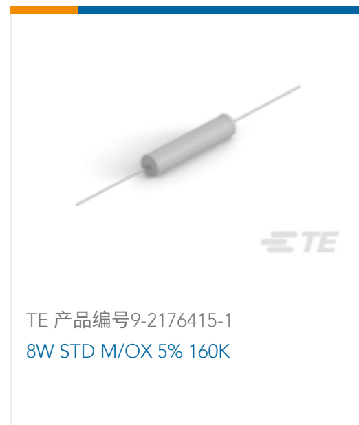
TE 产品编号 9-2176415-1 8W STD M/OX 5% 160K