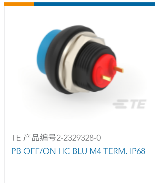
TE 产品编号 2-2329328-0 PB OFF/ON HC BLU M4 TERM. IP68