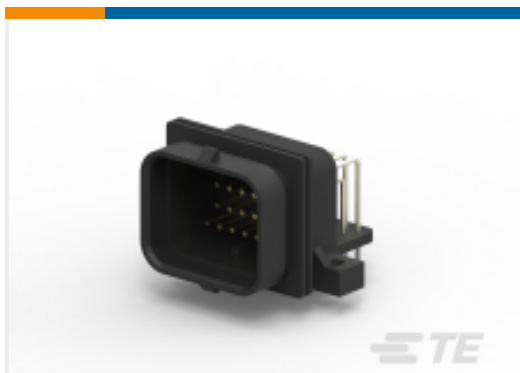
TE 产品编号2-6437285-8 SUPER SEAL 26POS CAP ASSY H AU