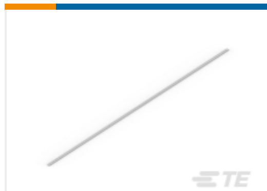
TE 产品编号1SNA163350R1500 PRH2R