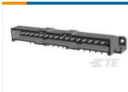
TE 产品编号207544-7 METRIMATE PIN HEADER ASSY,16P