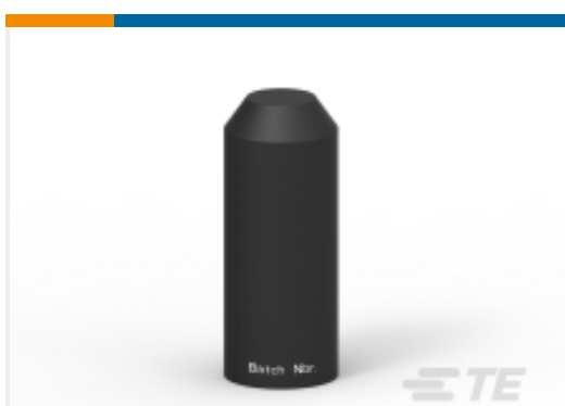
TE 产品编号845013N001 102L033/S(S100)