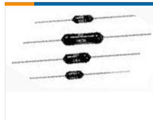
TE 产品编号9-1879664-1 H8 10K 0.1% 15PPM