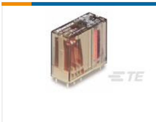
TE 产品编号1393845-4 RP821012