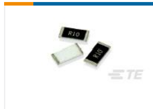
TE 产品编号 2-1879461-5 RL73H 2A R13 1% 1K RL