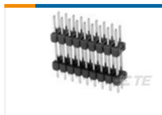
TE 产品编号 5-146496-2 04 MODII HDR DRST UNSHRD STKG