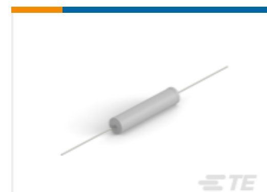
TE 产品编号 9-2176415-1 8W STD M/OX 5% 160K