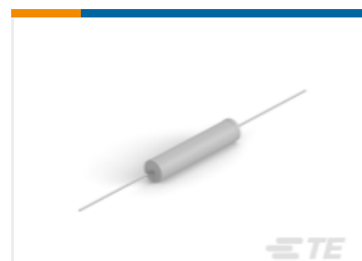
TE 产品编号 9-2176415-0 8W STD M/OX 5% 150K