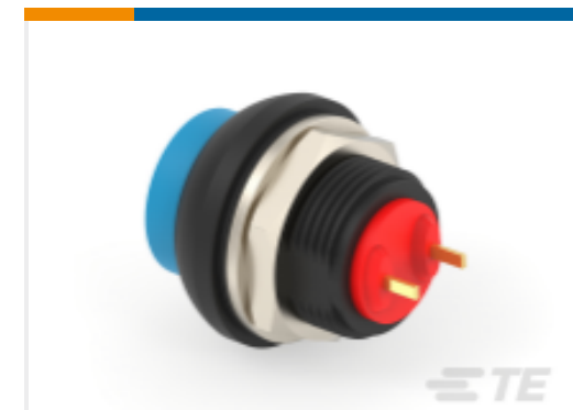
TE 产品编号 2-2329328-0 PB OFF/ON HC BLU M4 TERM. IP68