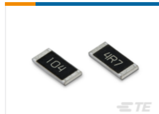
TE 产品编号 2-2176455-5 CPF 0402 7R5 0.1% 25ppm 1K RL