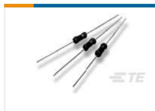
TE 产品编号 1-1625893-3 5W SM M/OX 2% 22R