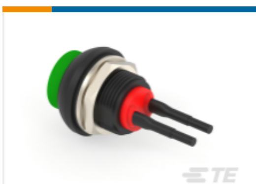
TE 产品编号 2329359-9 PB ON/OFF HC GRE M1 TERM IP68 500MM LHS