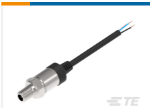
TE 产品编号 20014203-12 PRESS XDCR M325M-000005-250PG