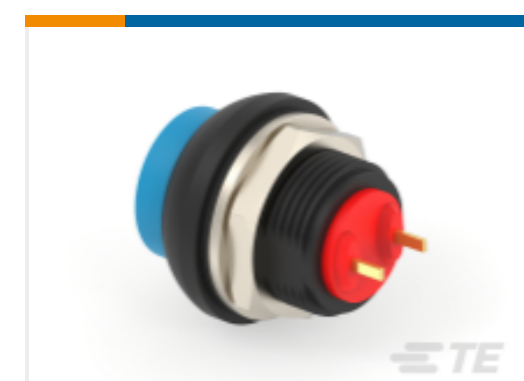
TE 产品编号2-2329328-0 PB OFF/ON HC BLU M4 TERM. IP68