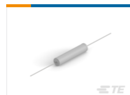
TE 产品编号9-2176415-1 8W STD M/OX 5% 160K