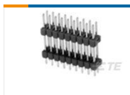
TE 产品编号5-146496-2 04 MODII HDR DRST UNSHRD STKG